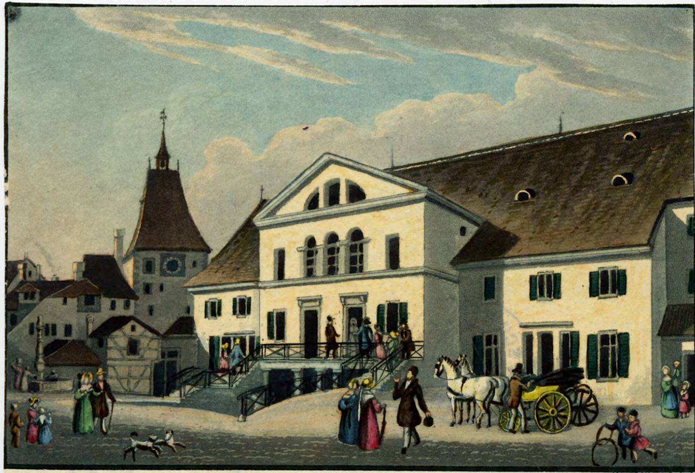
«Aktientheater» in the former church of the Franciscan monastery in Zurich. Aquatint by Franz Hegi, 1839