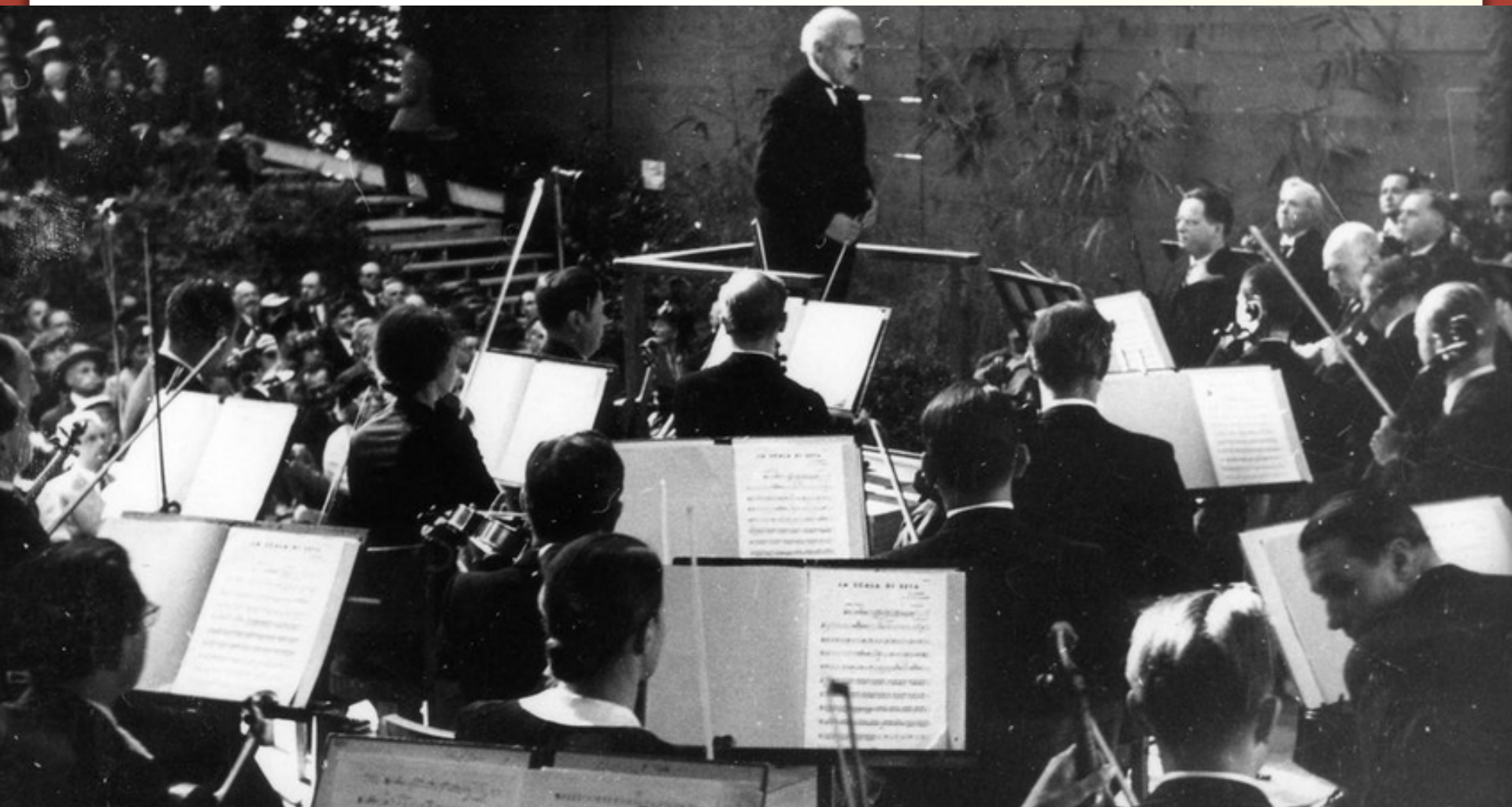
Toscanini conducts the overture from Rossini's «Scala di seta» at the first concert of the Lucerne festival in Tribschen, 1938