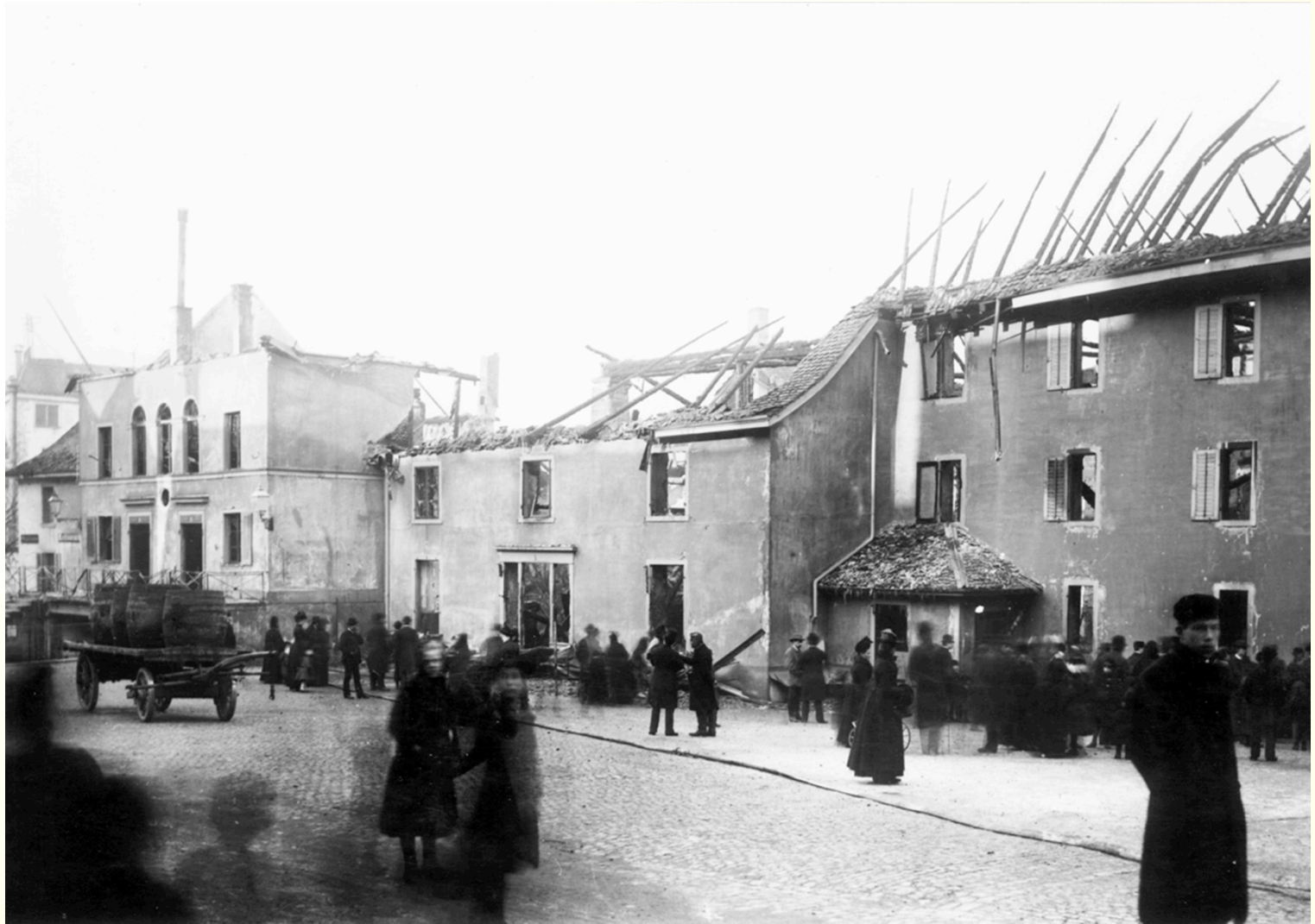
The «Aktientheater» after the fire in 1890